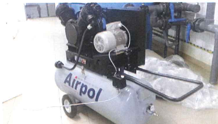
Zdj. Nowa sprężarka zakupiona na SUW Krzycko Wielkie