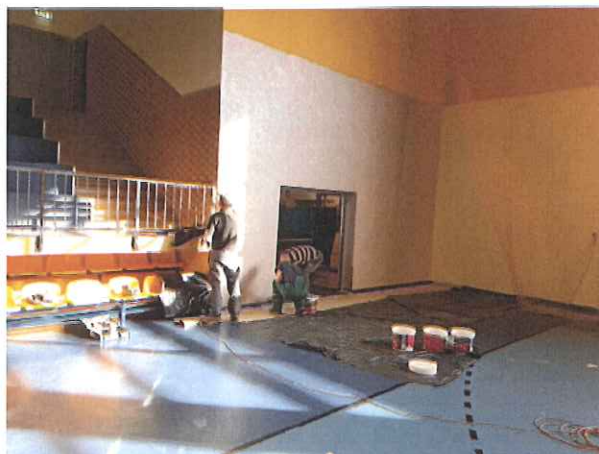
Zdj. Prace remontowe ścian bocznych na płycie boiska