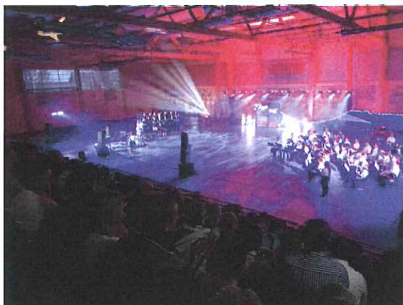
Zdj. Koncert „Magia Świąt”