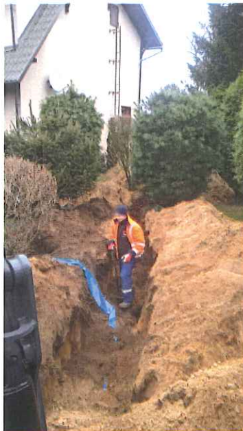
Zdj. Prace przy wymianie przyłączy na ul. Leszczyńskiej we Włoszakowicach