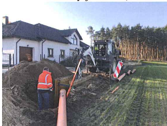
Zdj. Budowa kanalizacji sanitarnej na ul. Gajowej we Włoszakowicach