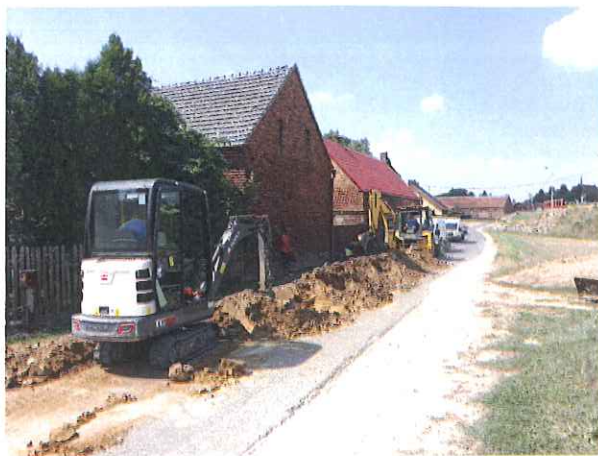
Zdj. Prace budowlane na ul. Spokojnej we Włoszakowicach