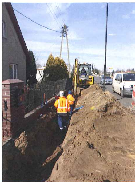
Zdj. Prace budowlane na ul. Powstańców Wlkp. we Włoszakowicach