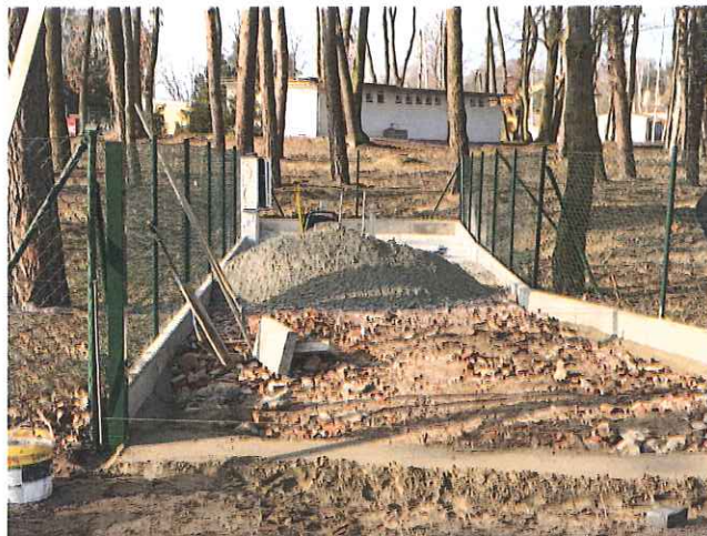
Zdj. Prace modernizacyjne pompowni ścieków Boszkowo-Letnisko ul. Turystyczna