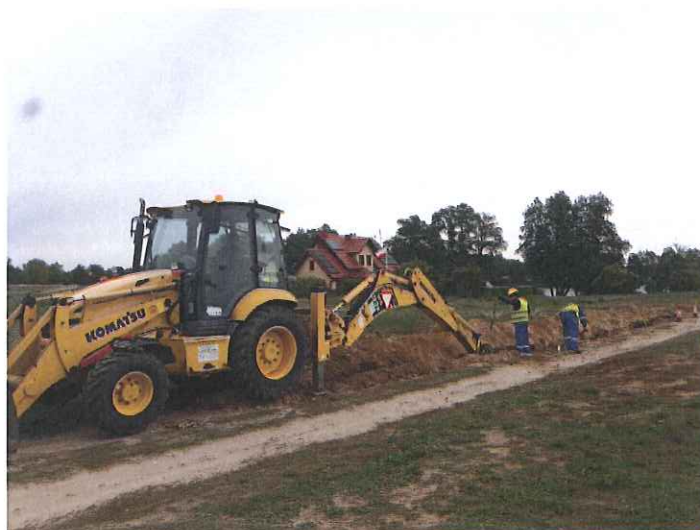
Zdj. Prace budowlane na ul. Gołaniczej w Krzycku Wielkim