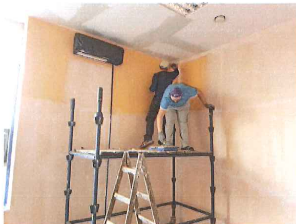
Zdj. Prace remontowe na salce fitness