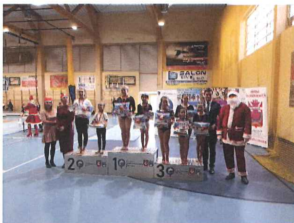
Zdj. Powiatowy Turniej Akrobatyki Sportowej