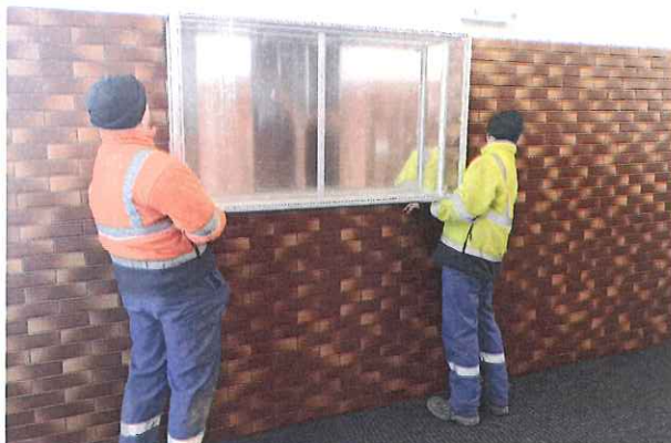
Zdj. Montaż nowej gabloty w korytarzu hali sportowej