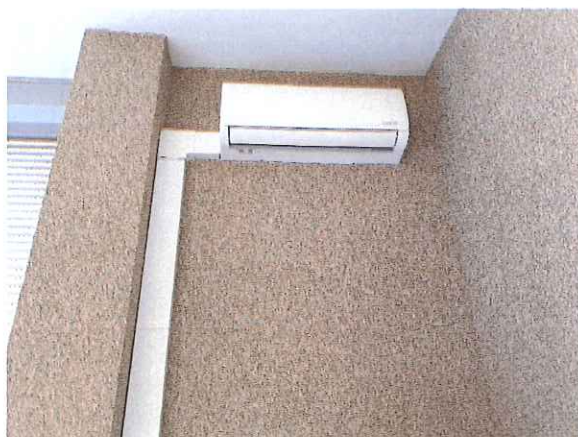
Zdj. Zainstalowana nowa klimatyzacja w salce fitness I