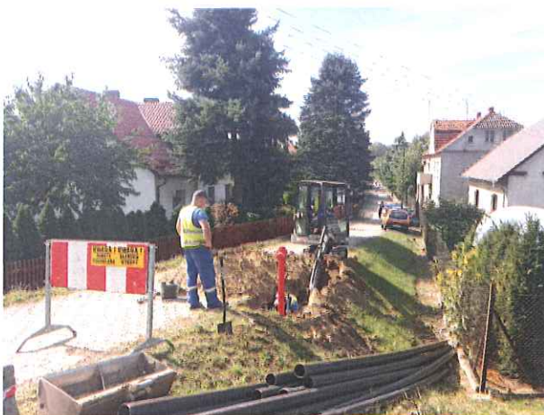
Zdj. Prace budowlane na ul. Dworcowej we Włoszakowicach