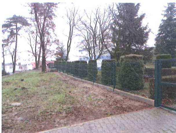
Zdj. Nowe ogrodzenie frontowe na SUW Włoszakowice