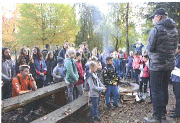
Zdj. Finał akcji „Sprzątanie Świata 2018”