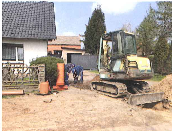
Zdj. Budowa przyłączy kanalizacji sanitarnej w Ujazdowie