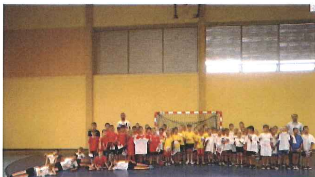
Zdj. Międzyszkolny Turniej Piłki Ręcznej Chłopców klas III SP