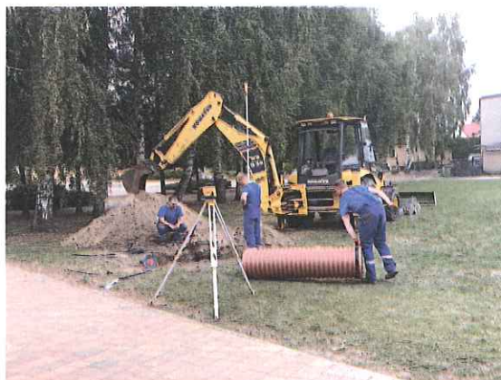
Zdj. Budowa sieci kanalizacji deszczowej stadionu lekkoatletycznego – etap I

Koszt wykonanych robót wyniósł 29 765,00 zł brutto (budżet gminy).