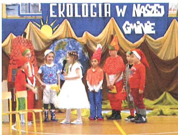
Zdj. Przegląd Teatralny „Ekologia w Naszej Gminie”