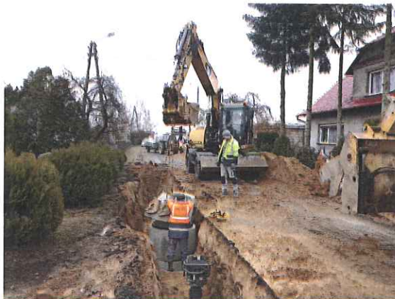
Zdj. Budowa kanalizacji sanitarnej w Ujazdowie

Kwota zakończonego kontraktu wchodzącego w zakres inwestycji POIiŚ wyniosła 1 831 347,00 zł brutto (budżet gminy).