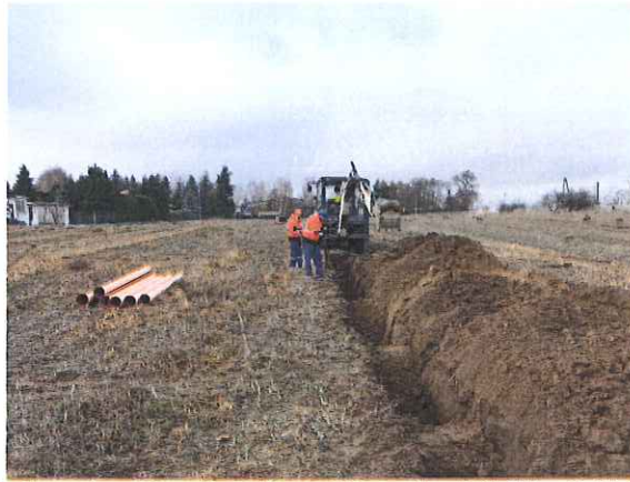
Zdj. Budowa kanalizacji sanitarnej Krzycko Wielkie ul. Gołanicka