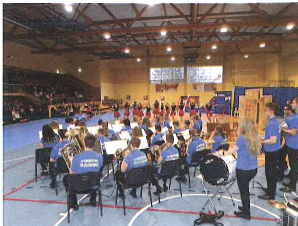
Zdj. Koncert WOSP