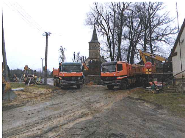
Zdj. Budowa sieci kanalizacji sanitarnej w Dłużynie