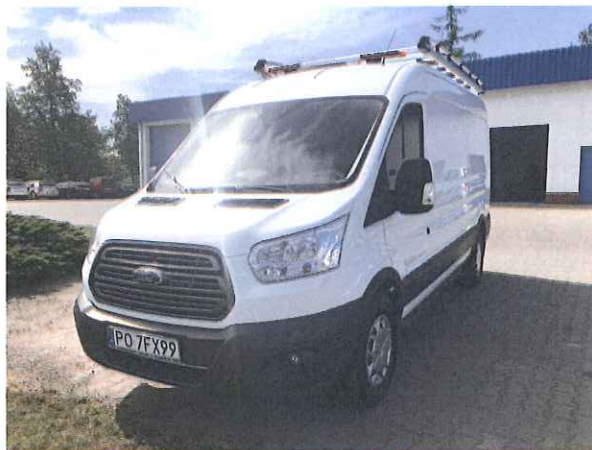
Zdj. Dostarczony nowy pojazd pogotowia wod-kan