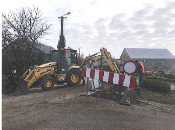
Zdj. Wymiana przyłączy wodociągowych na ul. P.A.Krzyckiego w Krzycku Wielkim